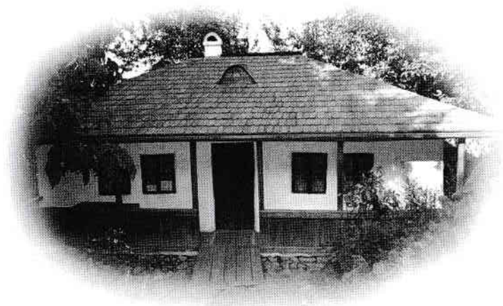
Bojdeuca lui Creangă

Fiecare dintre locurile acelea îi încălzea sufletul și, cu toate că era la sute de km distanță de casă și de ai săi, nu se simțea deloc singură.